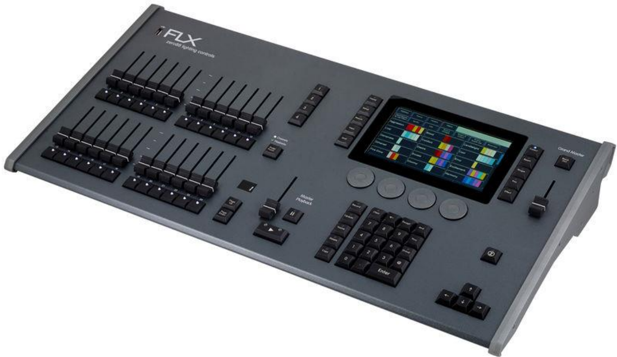
Patchlist Kulturschuppen Zero88, FLX